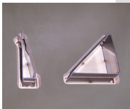
Dettaglio estrattore maschio + femmina "svasato"