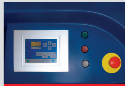
Touch-Screen e tasti comando

ProMill definisce nuovi standard di produzione e rappresenta la giusta scelta ad un prezzo attraente.